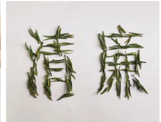
《清廉》 王瑞洁 赵平