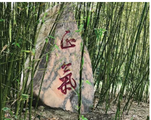
《秉清风 传清廉》 师秀娟